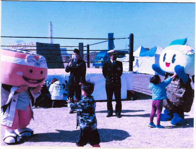
自衛隊PRタイム 陣のくわ ひろしのコラボは りまのこも 大人気