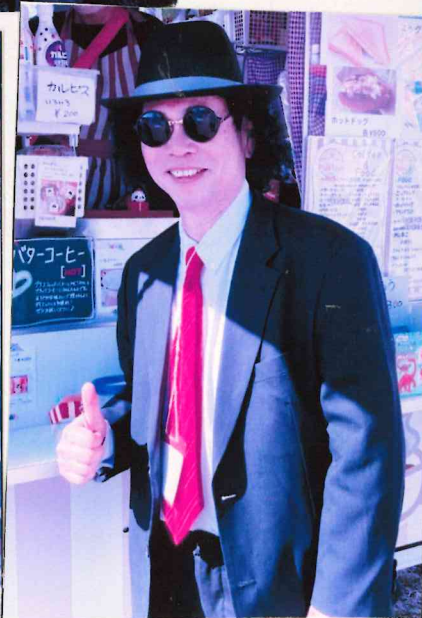
ボランティアさん