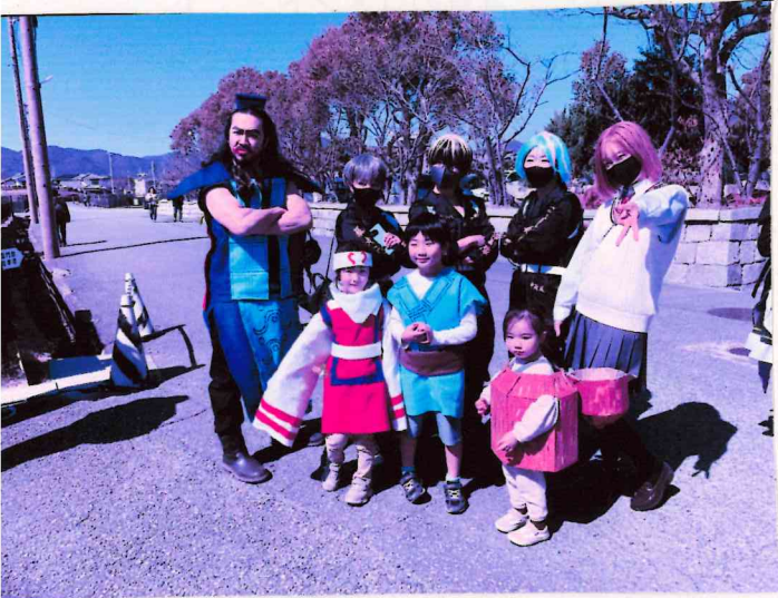
コスプレイヤーと親子コスプレ