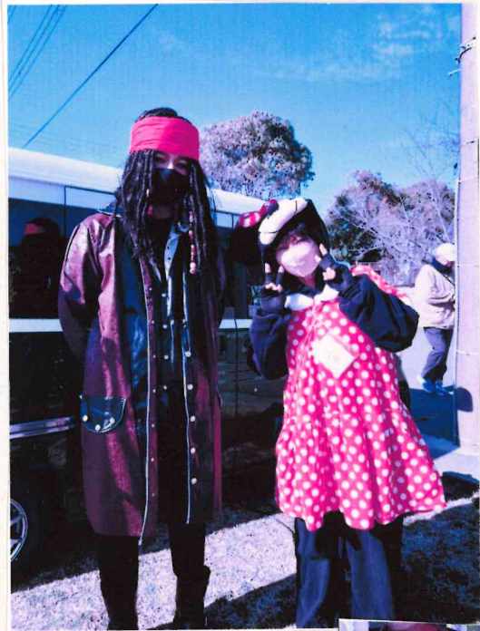
本店者 ボランティア