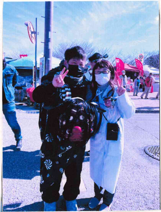
いよゑん 来場して くまのこ