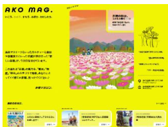
AKO MAG (トップページ) アクセス数 32,535 件

公式Webサイト「AKO MAG」において観光情報やイベント情報等を配信。また、Instagram アカウント「ほかる赤穂」ではグルメ情報、「Akotivity」ではアウトドアアクティビティ情報を中心に投稿。Instagramを通じて情報を発信するとともに、公式Webサイト「AKO MAG」への誘導を図った。