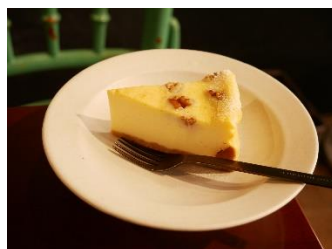
ほかる赤穂 (9/20 暖木) リーチ数 93,882 件 投稿数 26 回