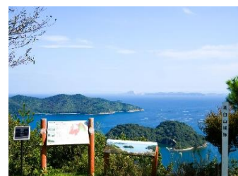
Akotivity (9/25 茶臼山) リーチ数 2,793 件 投稿数 8 回