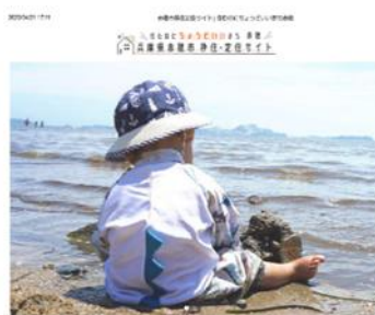
赤穂市移住定住サイト アクセス数 10,151 件

また、Instagram アカウト「えーで赤穂」では、赤穂市への移住・定住を促進するため、市内における何気ない日常の風景や、観光・イベント情報、移住相談会の案内などを発信。